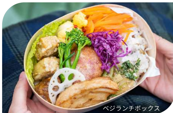
ベジランチボックス