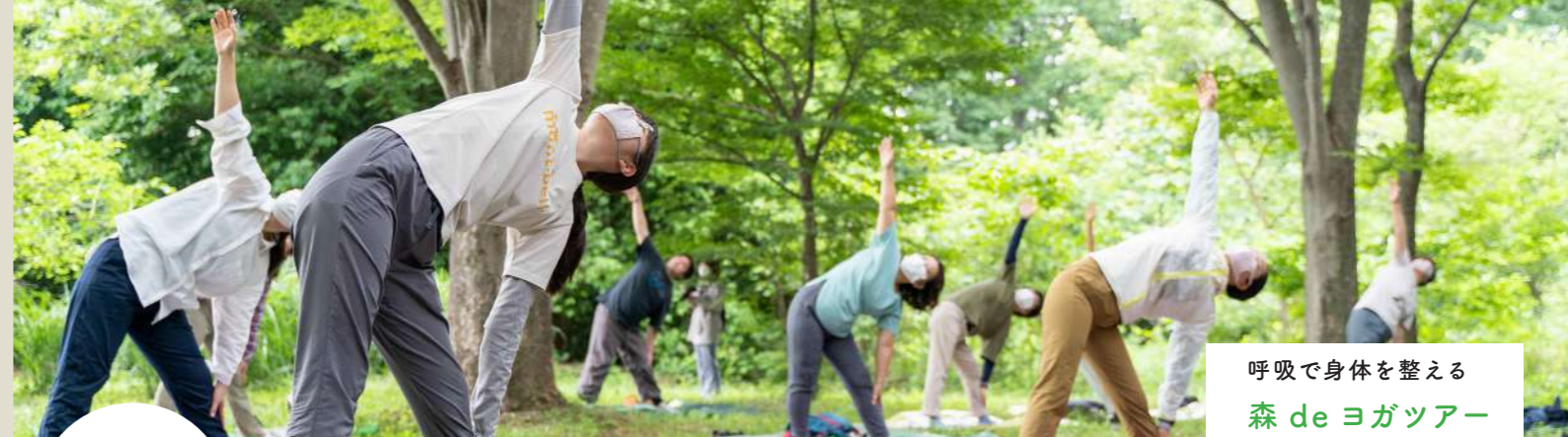
呼吸で身体を整える 森 de ヨガツアー

北本自然観察公園での森歩きを中心に、森の効果や心地よさを体感 できるガイドツアー。季節の見どころをご案内します。森林セラピー 初体験の方など、お気軽にご参加ください。